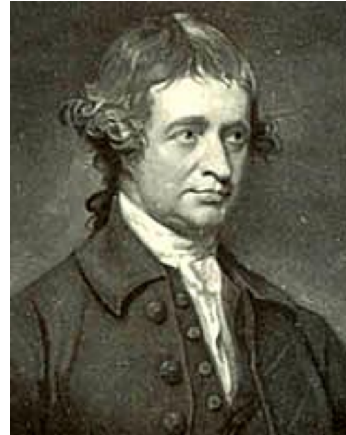
Edmund Burke (1729-1797)